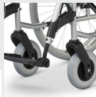
Vordere Sitzhöhe einstellbar ohne Teiletasch