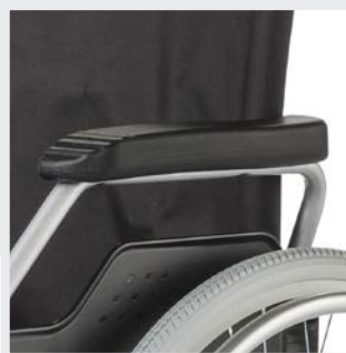
Verriegelbare Armlehnen nach hinten abklappbar