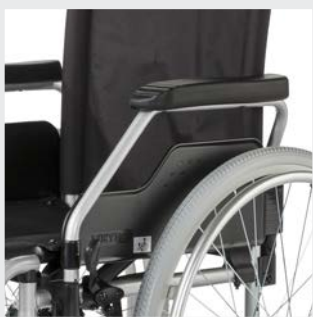
Komfortentnahmefunktion des Seitenteils